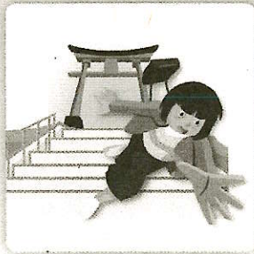
観光中に転倒してケガをした