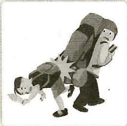
他人にケガをさせてしまった場合の損害賠償金