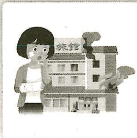
宿泊中火事にあいヤケドをした