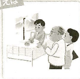
ケガで長期入院(14日以上)することになり、看護のため現地の病院まで来た親族が負担した交通費・宿泊費