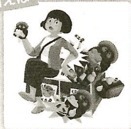
買い物中に商品を誤って壊してしまった場合の損害賠償金