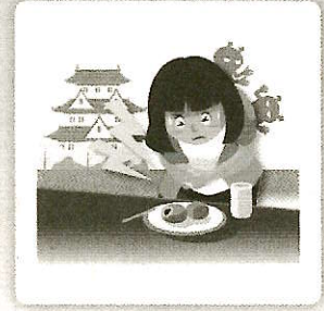
食中毒になり入院した