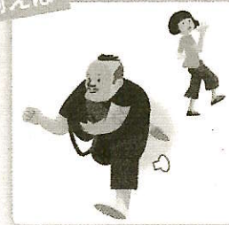
旅行バッグを盗まれてしまったことによる損害